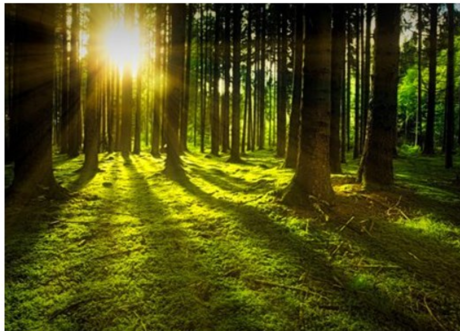
Treer i skogen

Les mer informasjon om webinaret på statsforvalterens nettsider