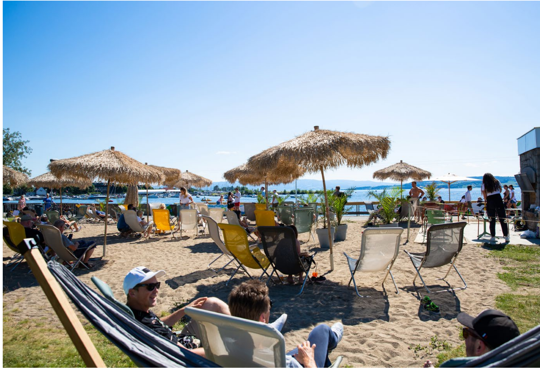
Bare å glede seg til sommer i Hamarregionen.