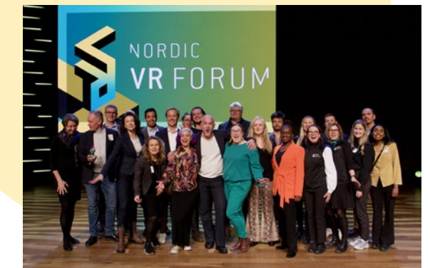
God vekst i teknologibedrifter og økt internasjonalt satsing. Bilde fra årlige Nordisk VR forum på Hamar Kulturhus.