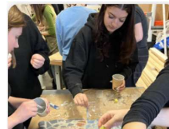
Elever lager sirkulær kunst for Oslos første plussenergiskole