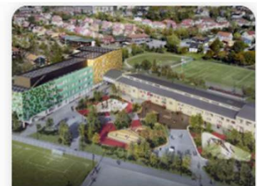
Oslos første plussenergiskole er i støpeskjeen