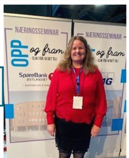
November 2024: Innlegg på Opp & Fram-konferansen