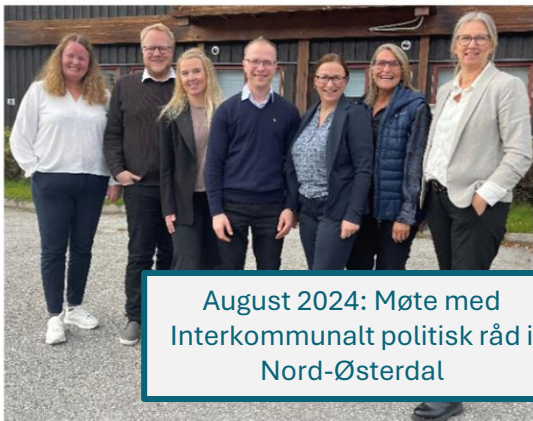
August 2024: Møte med Interkommunalt politisk råd i Nord-Østerdal