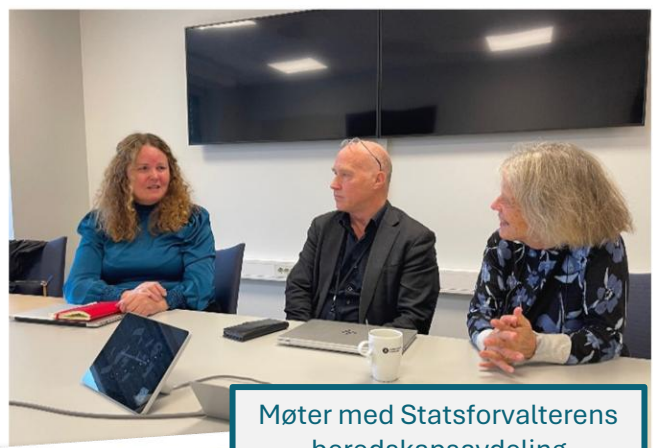
Møter med Statsforvalterens beredskapsavdeling