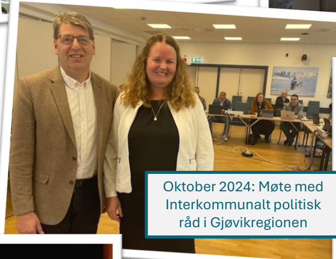
Oktober 2024: Møte med Interkommunalt politisk råd i Gjøvikregionen