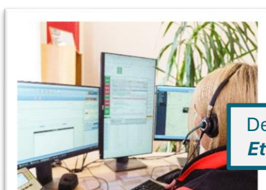
Debattinnlegg oktober 2024: Et taktskifte i beredskapen