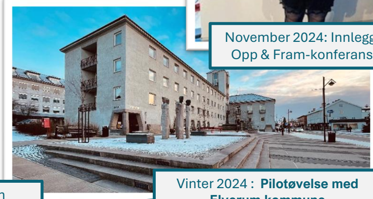
Vinter 2024 : Pilotøvelse med Elverum kommune