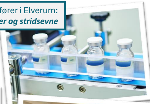
Kronikk juli 2024 med ordfører i Elverum: Vi trenger mer enn granater og stridsevne