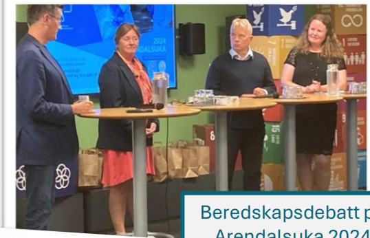
Beredskapsdebatt på Arendalsuka 2024